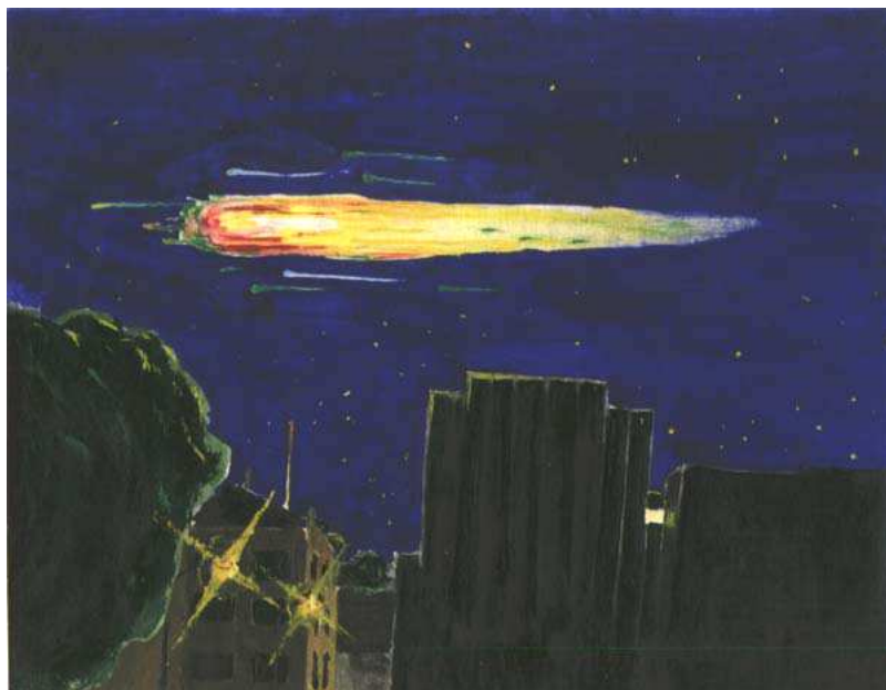
Рис.2. НЛО, спостережене 2 грудня 1983 року (картина художника В.Талалаєва)

Зрештою, як стало відомо з результатів прикінцевого розслідування, спостережений об'єкт виявився палаючою ракетною ступінню.